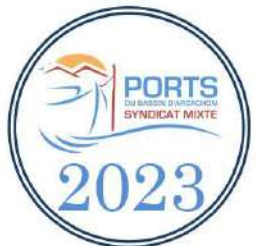
Place au Port