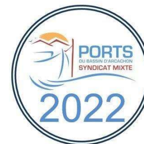
Place au Port