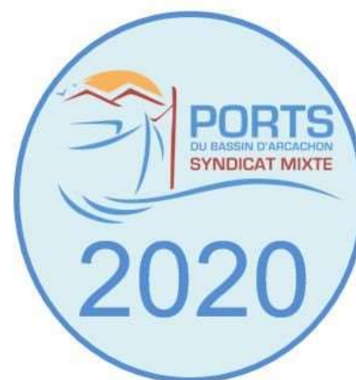
Places au port