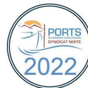
Place au Port